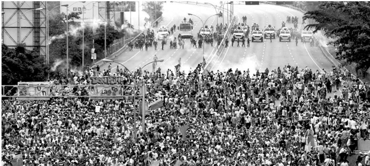
Movilización del pueblo venezolano contra el avance totalitario de Maduro

Ahora pretenden disfrazarse de "democráticos" convocando a elecciones regionales [...] que