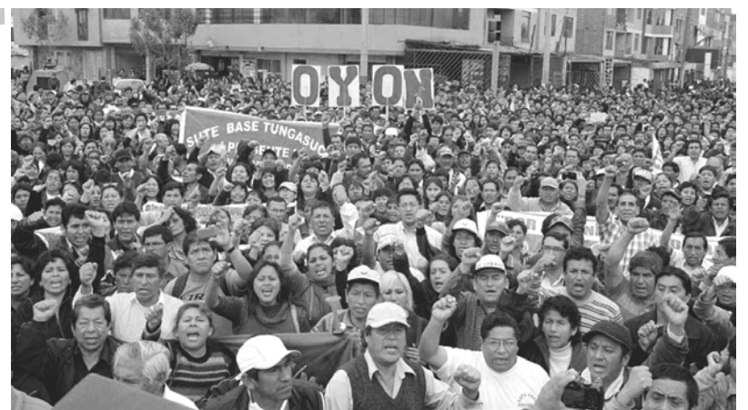
La lucha de los docentes peruanos ya lleva dos meses

Sin embargo, PPK se niega a dialogar con el Comité Nacional de Lucha (CNL) que agrupa a las otras organizaciones de base de los SUTE-Regionales. Por esa razón, el acta no es reconocida por todas las bases