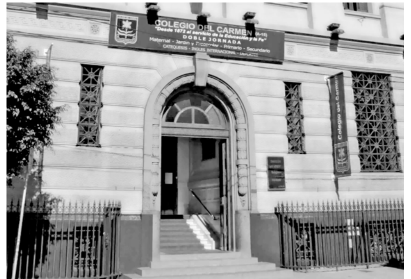
La Iglesia pretende avanzar sobre la educación pública

Rechazamos la enseñanza de cualquier religión en las escuelas públicas porque se trata de creencias no comprobables y no contrastables. Por tanto su imposición es un acto de abuso de poder por parte de la institución escolar. La religión corresponde al ámbito de lo