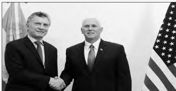
Macri y Pence

El vice de Donald Trump, Mike Pence, es un racista y derechista que apoyó la invasión a Irak y defiende la masacre del pueblo palestino a manos del Estado genocida de Israel. Viene a nuestro país a redoblar la política imperialista de un mayor sometimiento, colonización y endeudamiento externo de la mano de Macri. El presidente recibe a este chupasangre que viene a garantizar los negocios de las