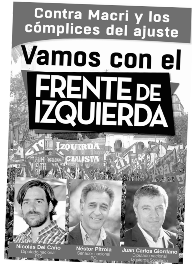
Volante de Izquierda Socialista con los tres referentes del frente

Otro tanto ocurrió con la filmación de los spots comunes, donde Izquierda Socialista ha tenido que dar importantes debates para que sean incorporados o nombrados sus candidatos, y no que solo aparezcan quienes encabezan las listas, es decir, los candidatos del PO y el PTS, ya que Izquierda Socialista no encabezó ni a legislador ni a diputado nacional en CABA; ni a diputado nacional, senador ni legislador de la Tercera Sección Electoral en Buenos Aires. En Córdoba, donde la principal