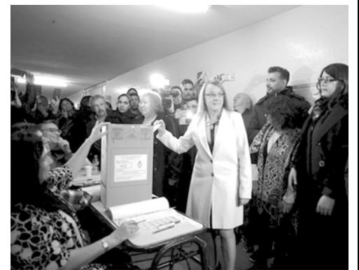
Alicia Kirchner votando rodeada de custodios

Otro de los hechos políticos simbólicos y reales de estas elecciones fue la derrota catastrófica del kirchnerismo "puro" en Santa Cruz. Una provincia totalmente en crisis, donde no funcionan las escuelas, los hospitales ni la justicia, hay permanentemente acampes de jubilados y trabajadores en las calles de Río Gallegos luchando por cobrar y por aumentos salariales, se corta la luz, falta el gas y el agua en numerosas localidades. ¡A mediados de agosto todavía no hubo ni un solo día de clases por responsabilidad del gobierno que se niega a solucionar los problemas de los docentes! Las escuelas se abrieron por primera vez el domingo para que la gente pudiera ir a votar. Aquí, después de 30 años de kirchnerismo, Alicia sufrió la peor derrota histórica, llegando apenas al 30% de los votos. Cambiemos logró ganar con un 45,43%, aunque creían que sacarían más votos. Y el Frente de Izquierda, integrado por Izquierda Socialista y el Partido Obrero, obtuvo una de las votaciones más altas del país, con el 8,25% y logrando el tercer lugar en diputados, arriba del ex gobernador Peralta, que fue aliado con Pino Solanas y Proyecto Sur. ¡En la zona norte petrolera, de Caleta Olivia,